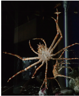
脚一本でバランスをとって登ろうとしています。まるでボルダリング!

本種が生息する日本周辺の深海は平らな地形ばかりではなく、岩や斜面が数多くあります。そのような場所で活躍するのがこの長い脚。バランスを取りながら縦横無尽に移動します。生物園でも時折、写真のように大きく脚を広げて岩などを登る様子が見られます。どんな海底でも歩き回るタカアシガニの技をぜひ観察しにきてください。