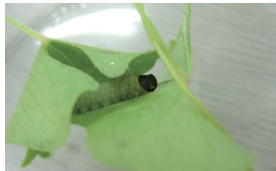
葉をつづるダイミョウセセリの幼虫

生物園でチョウの世話をする中で、私が大好きなのが「巣を作る幼虫の姿」です。身近なチョウの中ではセセリチョウの仲間やアカタテハなどです。卵から飼育をした時、孵化したばかりの幼虫が懸命に葉をつづる姿に私は感動しました。チョウの幼虫にとって、巣作りは敵から身を隠すための生存戦略のひとつです。そのため、生まれてすぐ作