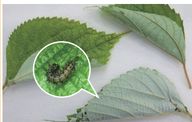
アカタテハの幼虫の巣

らなければならないのですが、自分の体にぴったりの巣をつくるなんて職人技ではありませんか？