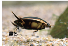
ヒメフチトリゲンゴロウ