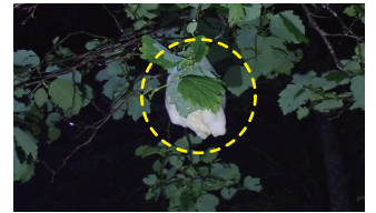
モリアオガエルの卵塊