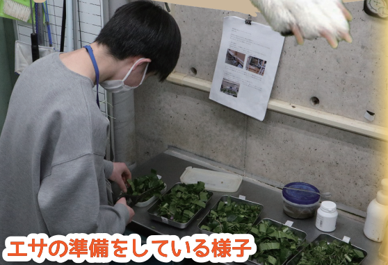
エサの準備をしている様子

往復ハガキに①イベント名、参加者全員の②住所 ③電話番号 ④氏名(ふりがな)⑤年齢(学年も)⑥希望時間どちらか⑦希望コースいずれかを明記の上、 締切日必着 で生物園宛にご郵送ください。(返信面にも宛名を明記してください。)*ハガキ郵送中の紛失などの事故につきましては、責任を負いかねますのでご了承ください。重複応募は無効となります。