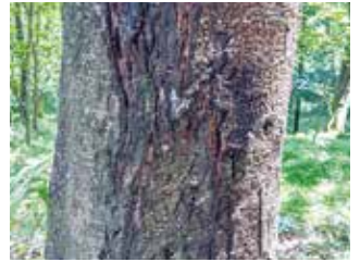
ツキノワグマのつめ跡