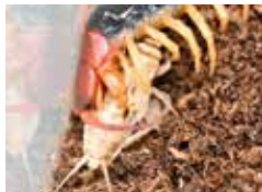
ココロギを捕まえているようす