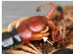
頭の次の節も鶯色で顎肢(矢印部分)が出ている

頭の付近をよく観察してみましょう。頭の次の節も鶯色をしており、この節から牙のようなもの(顎肢)が出ていることがわかります。ムカデが獲物を捕える時には顎肢を獲物に突き刺し、ここから毒を注入します。ムカデが頭を出している時に観察してみてください。