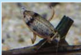
ハイロゲンゴロウ