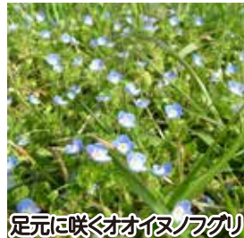
足元に咲くオオイヌノフグリ