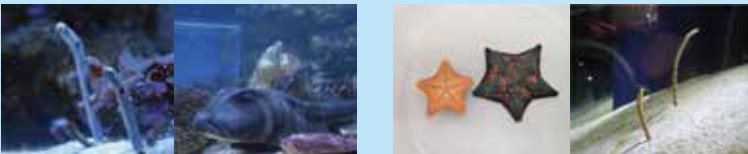
チンアナゴ ネコザメ イトマキヒトデ ニシキアナゴ