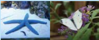
アオヒトデ モンシロチョウ