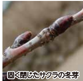
固く閉じたサクラの冬芽

まだ寒い日が続いていますが、季節は確実に進んでいるようです。木々の冬芽はまだ固く閉じていますが、足元ではオオイヌノフグリが瑠璃色の小さな花を咲かせています。冬鳥のジョウビタキを見かけたかと思うと、まだ下手なウグイスのさえずりが聞こえてきます。生物園の池には、そろそろアズマヒキガエルが産卵のために集まって来るはず。冬と春が入り混じっているこの季節、公園の「巡回」をしながら「散策」に出るのを楽しんでいます。気温だけでなく、音や色、香りなど、五感を使って季節の移り変わりを感じるのもいいものです。みなさんもぜひ季節のグラデーションを感じに散歩に出かけてみませんか？